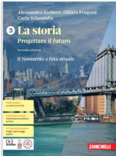
A. Barbero, C. Frugoni, C.Sclarandis - La Storia. Progettare il futuro , Zanichelli 2024, 2 ed. Vol. 3, pagg. 104-107