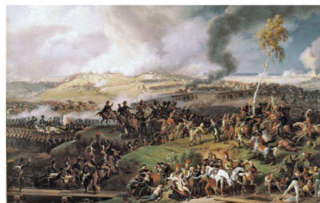
► La battaglia di Borodino in un dipinto di Louis-François Lejeune (1822), conservato nel Castello di Versailles.

– Non prendere prigionieri, – seguì il principe Andréj. – Soltanto questo cambierebbe tutta la guerra e la renderebbe meno crudele. E noi invece abbiamo giocato alla guerra, ecco il male; noi facciamo i magnanimi, e così via. Questa magnanimità e questa sensibilità sono del genere della magnanimità e