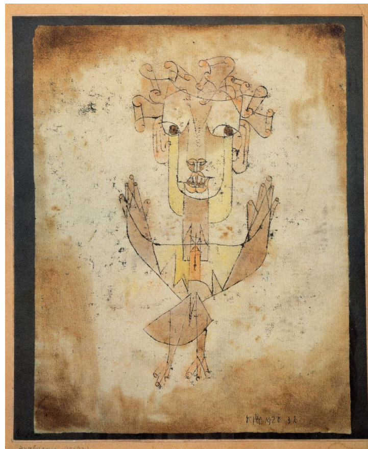
Paul Klee, Angelus Novus