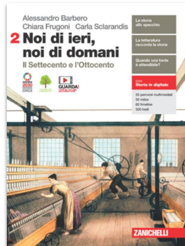
A. Barbero, C. Frugoni, C. Sclarandis - Noi di ieri, noi di domani , Zanichelli 2021. Vol. 2, pag. 191